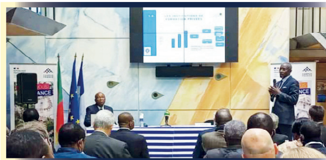
Le Recteur présente le paysage de l'enseignement supérieur Camerounaise

Ce paysage a été présenté en deux principales parties : la première portait sur les acteurs de l'enseignement supérieur et leur déploiement sur le territoire national; la seconde sur les logiques et le système de formation à l'œuvre. Sur la base de la Stratégie nationale de développement du Cameroun à l'horizon 2030 et du Cadre stratégique de performance du ministère de l'Enseignement supérieur, les priorités du gouvernement ont été présentées en quatre programmes. Ces programmes comprennent : le développement de la composante technologique et professionnelle, la modernisation et la professionnalisation des établissements facultaires classiques, le développement de la recherche et de l'innovation universitaires, la gouvernance et l'appui institutionnel. Il en ressort que le paysage de l'enseignement supérieur