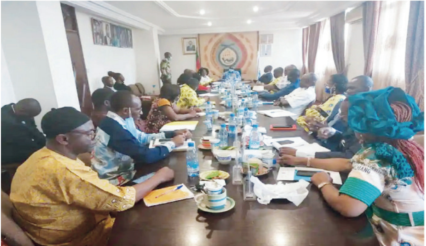
Séance de restitution de l'Inspection Général des Services du MINESUP à UDs