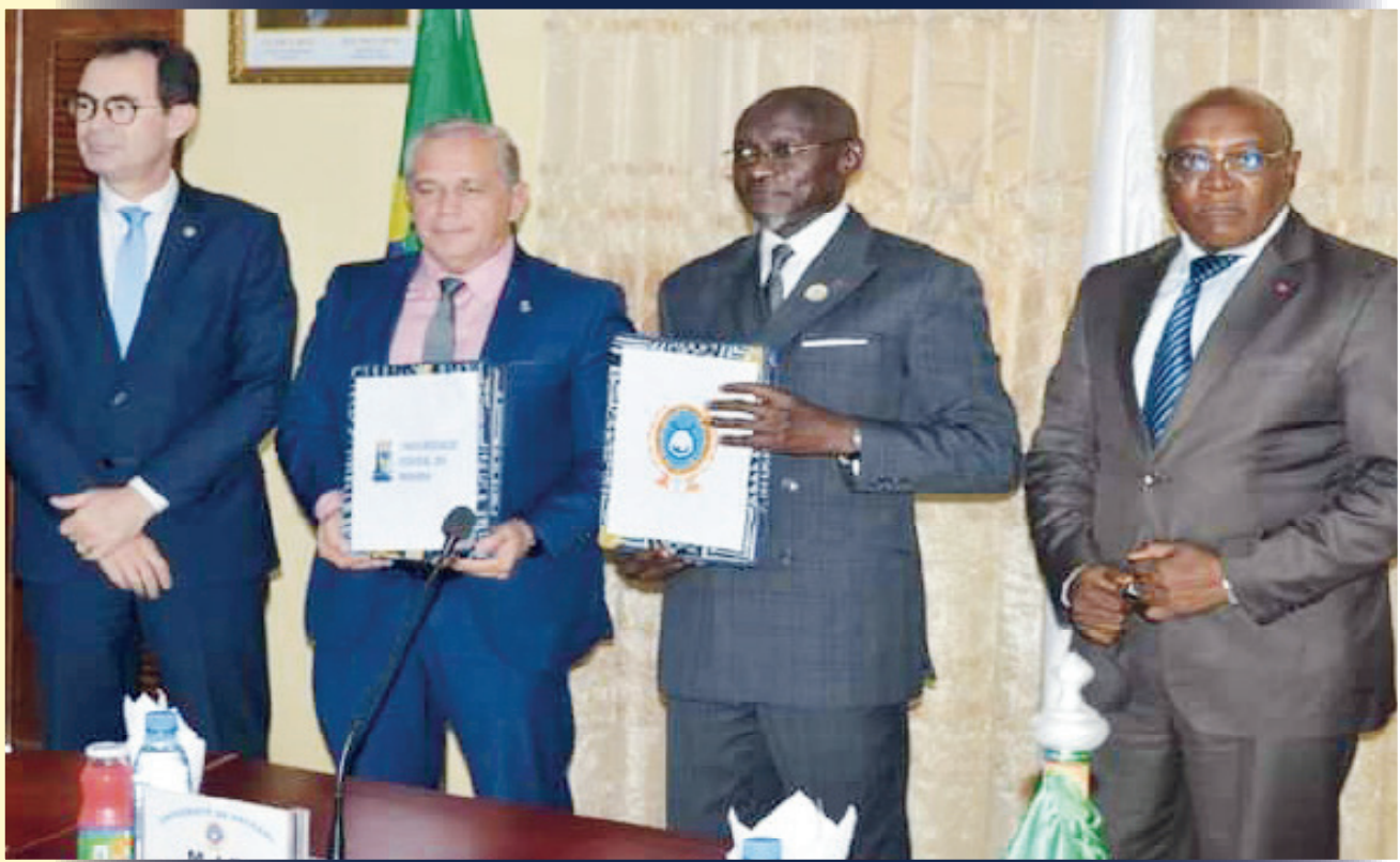
Signature de convention entre l'UDs et les universités Brésiliennes

Le Ministère de l'enseignement supérieur du Cameroun au four et au moulin