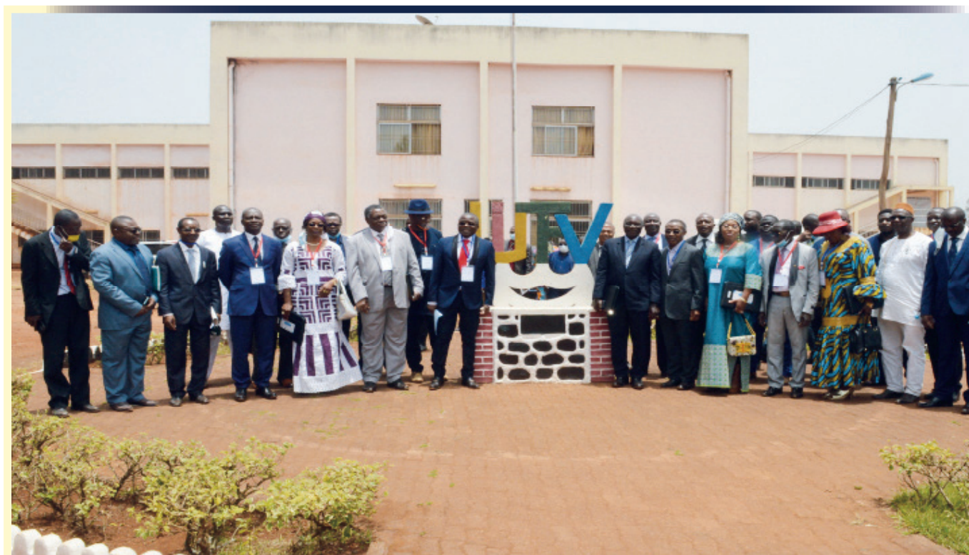
Cérémonie d'ouverture de la Conférence Internationale à IUT-FV de Bandjoun

Les travaux de la première ICESD 2022 sont placés sous le haut patronage du Ministre d'État, Ministre de l'Enseignement Supérieur le Prof Jacques FAME Ndongo.