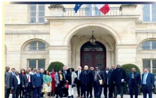
La délégation camerounaise au Ministère Français de l'enseignement supérieur

le système d'enseignement supérieur et de formation professionnelle français. Au-delà de la participation à « la Journée Pays Cameroun » au siège de Campus France, la délégation camerounaise a également pris part à l'inauguration de la grande exposition sur « La Route des Chefferies du Cameroun : du visible à l'invisible » qui s'est tenue au Musée du Quai Branly Jacques Chirac.