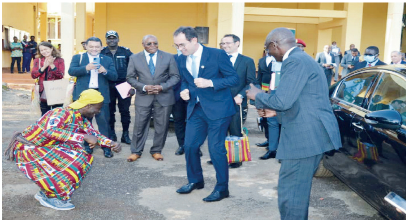
Accueil du Secrétaire d'Etat à l'enseignement supérieur par la communauté universitaire

La troisième étape fut la visite guidée de quelques infrastructures. La délégation a ainsi pu se rendre compte de visu des activités de la ferme agropastorale, les diverses infrastructures sportives et autres installations socioculturelles du campus principal de Dschang. C'est en toute beauté que les délégations ont bouclé leur périple par une descente au cœur des traditions ancestrales à la chefferie traditionnelle du village Foréké-Dschang.